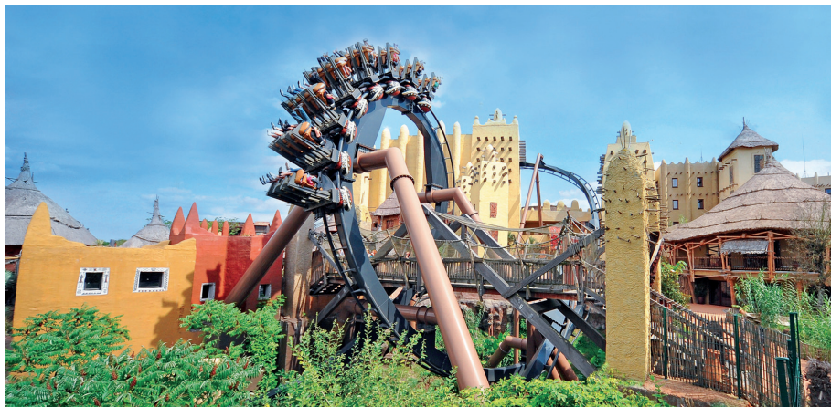
Sortie d'une journée